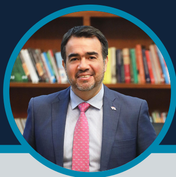
Oscar Llamosas Ministro de Hacienda